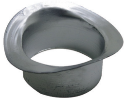
PITÓN PA' CANAL HG A/LLUVIA