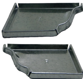
TAPA DER. P' CANAL HG A/LLUVIA